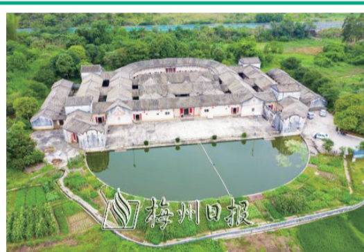
興寧保存最完好的四角圍龍屋盤安園。