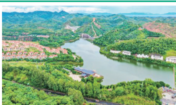
國家4A級旅遊景區——熙和灣客鄉文化旅遊產業園。