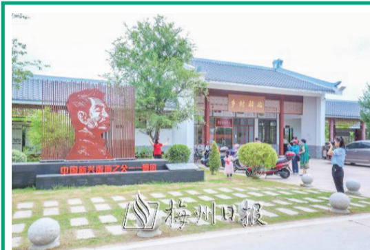
十裏版畫長廊展版融入“兩鎮五村”的一河兩岸景觀中。